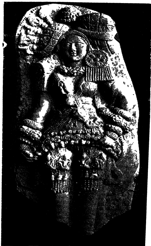
श्री मा देवता—शुंग कालीन पकी मिट्टी की छोटी मूर्ति